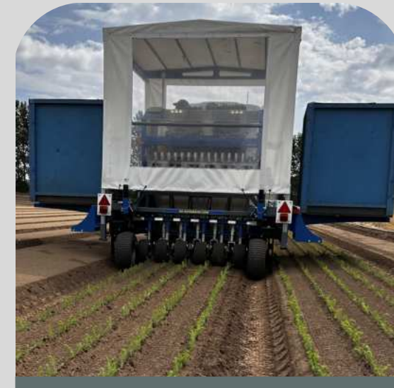
Plantación de árboles 5 líneas un robot