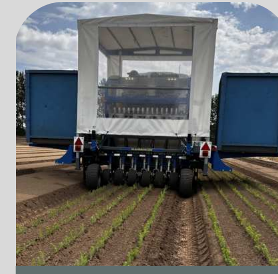
Bomenplanten, 5 rijer, één robot

De plantcapaciteit is afhankelijk van de variant plant-tray die wordt gebruikt. Vraag TTS om een berekening