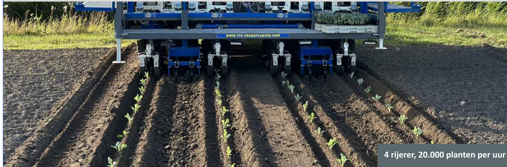
4 rijer, 20.000 planten per uur