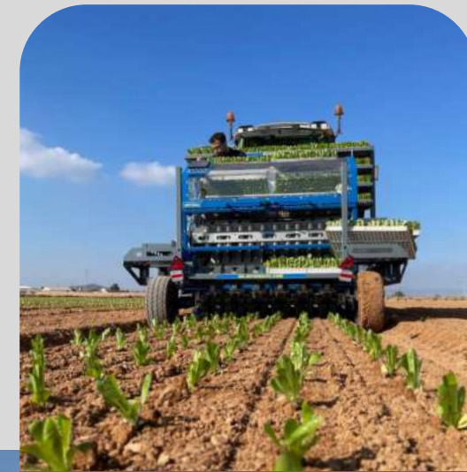
6 rijer, ook beschikbaar als zelfrijdend